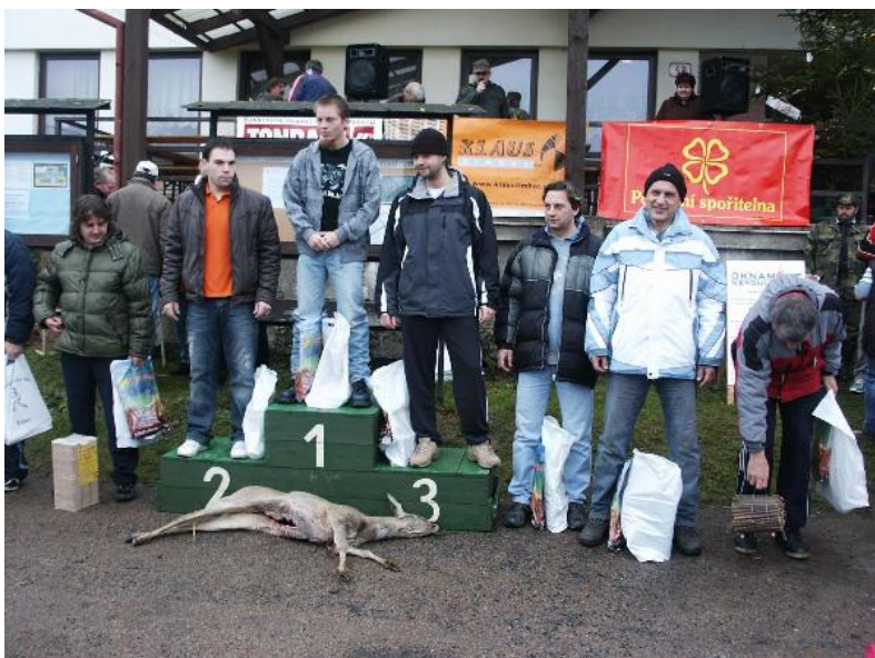
Domácí vítězové 19.ročníku Silvestrovského běhu

Investiční akce v r.2010 jsou připravené na dotace v rámci opravy klubovny hasičů ve Žďáru a opravy kapličky ve Smederově. Mateřská školka získala další souhlasy k územnímu řízení a byla vykoupena většina pozemku pro její stavbu. Zbývá ještě menší část a o té se jedná. Potom