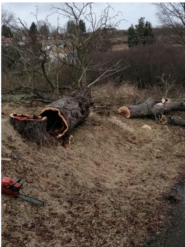
Foto: vykácená kaštanová alej ve Žďáře

směny, momentálně po nás požaduje doplatek tržní ceny za jejich pozemky. O výsledcích jednání vás budeme informovat. Veřejné zasedání zastupitelů obce se uskuteční v pátek 25. února od 18.00 hodin ve Ždírecké hospodě. Všichni jste srdečně zváni.