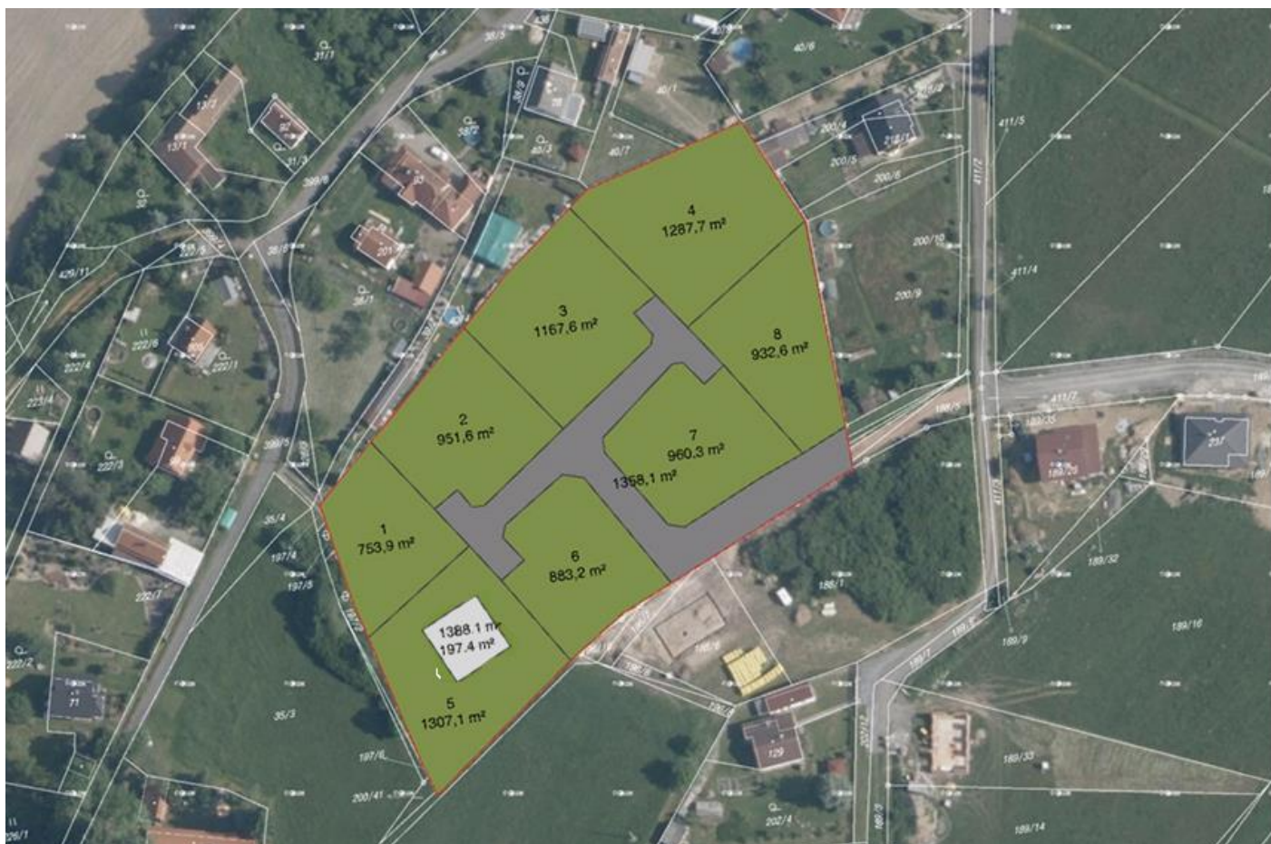
Návrh jedné z možných variant řešení rozmístění stavebních parcel.

možností, jak zajistit financování. Další možností je také forma dotací. Ta je v tomto případě však tak nízká, že by stejně většinu nákladů obec musela hradit ze svého rozpočtu. Chtěli bychom najít nejlepší způsob řešení nové výstavby co nejrychleji, aby se naši mladí lidé, kteří z obce pochází, žijí u svých rodičů a chtějí zde se svými partnery zůstat, nemuseli z důvodu absence stavebních pozemků stěhovat jinam. Bohužel, nikdo nemládne. A tak v neposlední řadě myslíme i na naše starší občany, kterým ubývá síly. Někteří by možná rádi uvítali výměnu svého velkého a prázdného domu s rozlehlou zahradou za menší byt s malou zahrádkou, aby i nadále mohli pohodlně žít v jejich rodné obci.