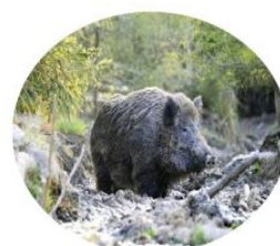
PRASE DIVOKÉ – 30 Kč