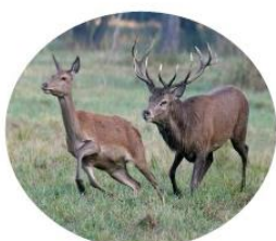
JELENÍ – 60 Kč