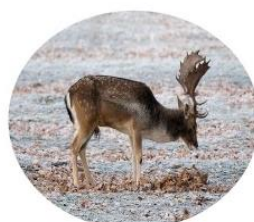
DANČÍ – 60 Kč