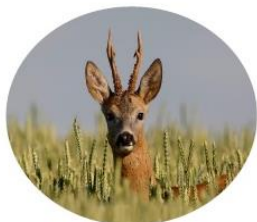
SRNČÍ – 80 Kč

Uvedené ceny za kg (platí se v hotovosti při předání kusu)